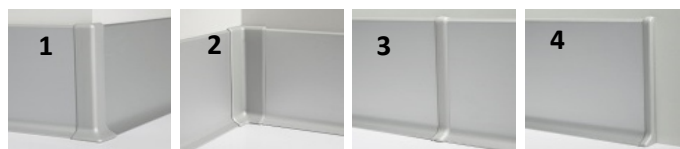
1. ângulo externo 2. ângulo interno 3. união 4. terminal*