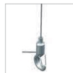
Gancho de suspensão