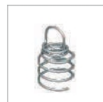
A - Fixação em espiral a 15 cm dos cantos