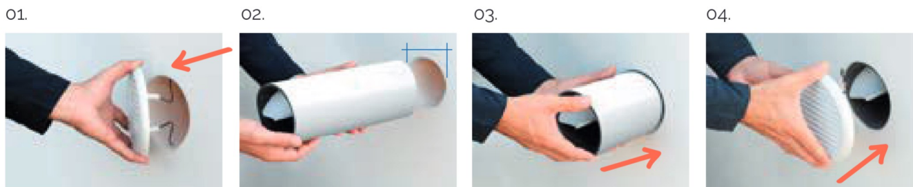
01. Estrarre la griglia esistente dal foro di ventilazione.

HELIX 34 è un dispositivo insonorizzante per fori di ventilazione di muri perimetrali e/o condotti di ventilazione. Il prodotto consente un abbattimento acustico certificato di 34 deciBel (test effettuati in conformità alle norme vigenti) con un passaggio aria di 100 cm 2 a norma UNI CIG GAS 7129. Si raccomanda l'installazione di griglie con passaggi aria certificati de "LA VENTILAZIONE"