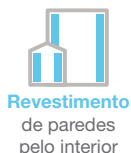
Revestimento de paredes pelo interior

Adequada para a utilização em obras de construção e reabilitação, tais como revestimento de paredes pelo interior e tetos falsos.