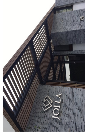
TEAK Morelia, Mich.