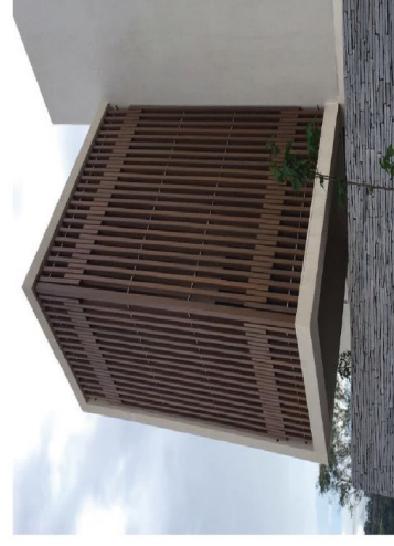
TEAK Michoacan, M.